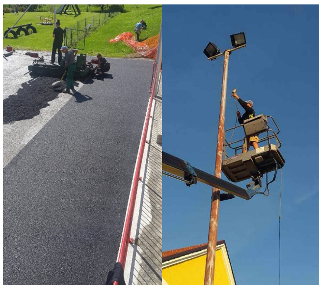
Slika: Obnova igrišča