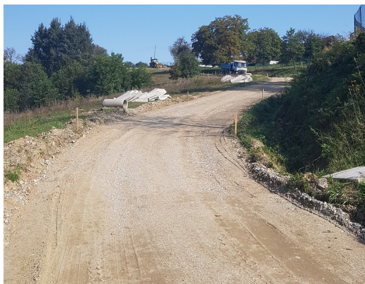
Slika: Modernizacija 2017

Predmetni odseki občinskih cest v skupni dolžini cca. 735 m, ki so bili do nedavnega še v makadamski izvedbi, so bili uspešno predani v uporabo. Odsek v Brengovi se bo v preostalem delu (II. Faza) v dolžini cca. 600 m se izvedel v letu 2018.