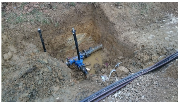
Slika: Obnova vodovoda Cogetinci-Kadrenci