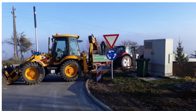
Obnova vodovoda v Peščenem Vrhu