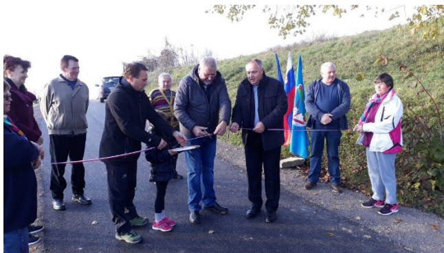
Slika: Otvoritev ceste