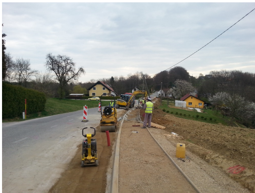
Slika: Obnavljanje pločnika