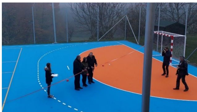
Slika: Otvoritev obnovljenega igrišča