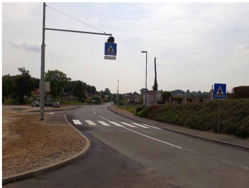
Slika: Obnovljena regionalna cesta s pločnikom in JR